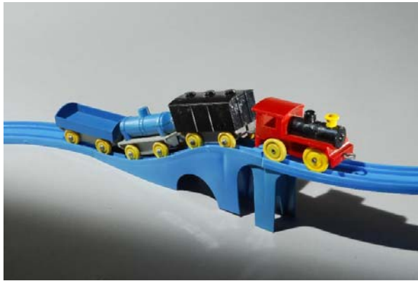
1959年発売 初代プラレール「プラスチック汽車・レールセット」